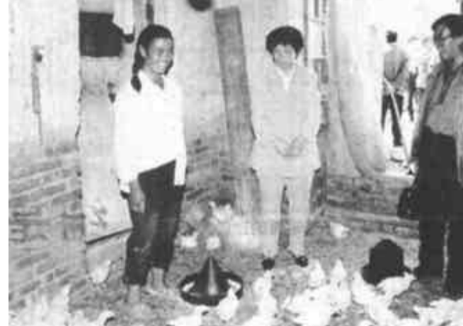
垦利县转变土地利用方式