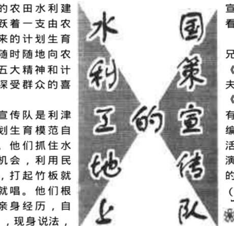
水利工地上 国策宣传队

在利津县的农田水利建设工地上，活跃着一支由农民自愿组织起来的计划生育工作组，他们向农民宣传计划生育政策和计划生育知识，深受群众的喜爱和欢迎。这支文艺宣传队是利津县店子乡的计划生育模范自愿组织起来的。他们抓住水利工地人多的机会，利用民工休息的间隙，打起竹板就唱，拉起胡琴就唱。他们根据本地实际和亲身经历，自编自演文艺节目，现身说法，